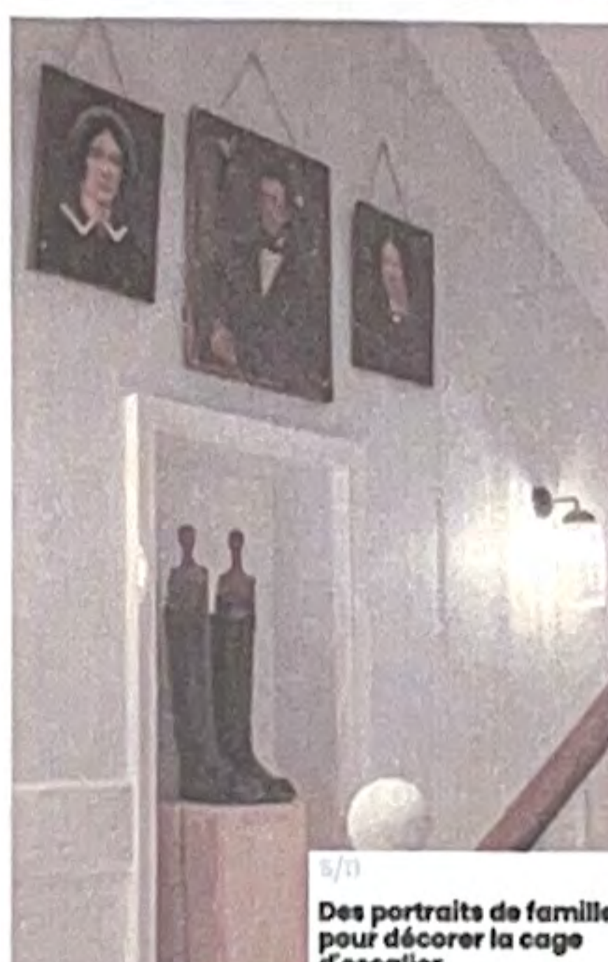
5/1 Des portraits de famille pour décorer la cage d'escalier