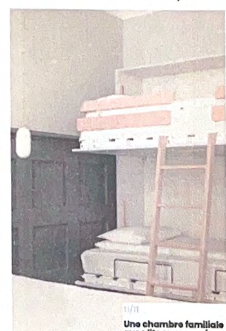
11/1 Une chambre familiale avec lits superposés