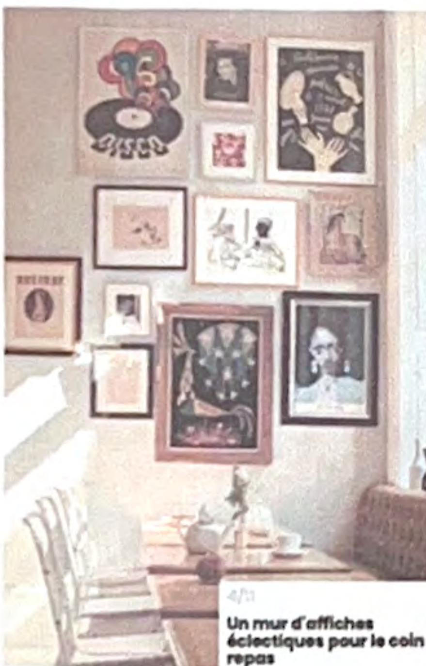
4/1 Un mur d'affiches éclectiques pour le coin repas