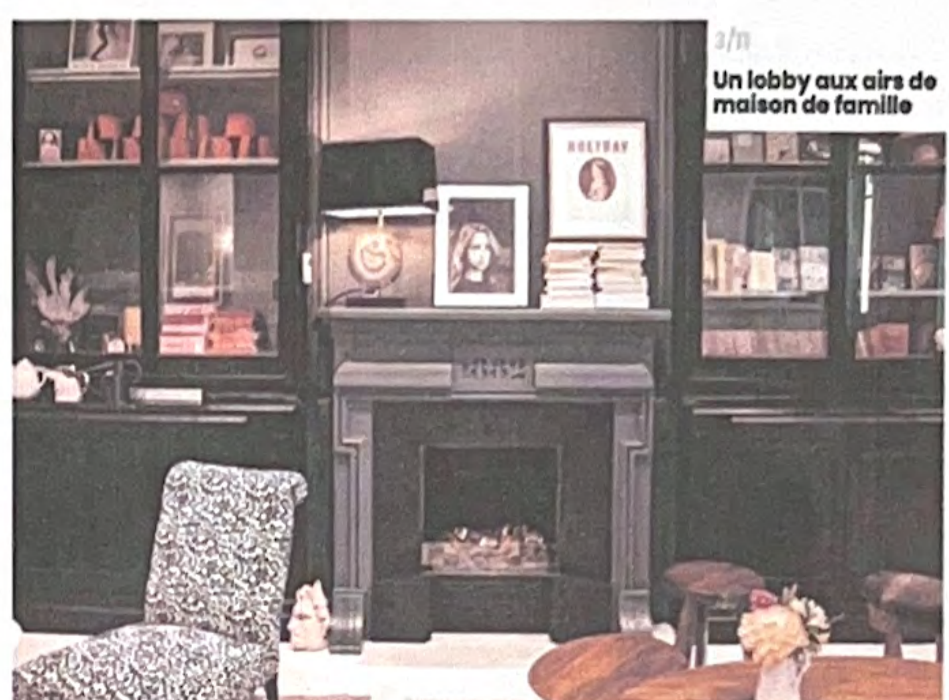
3/1 Un lobby aux airs de maison de famille