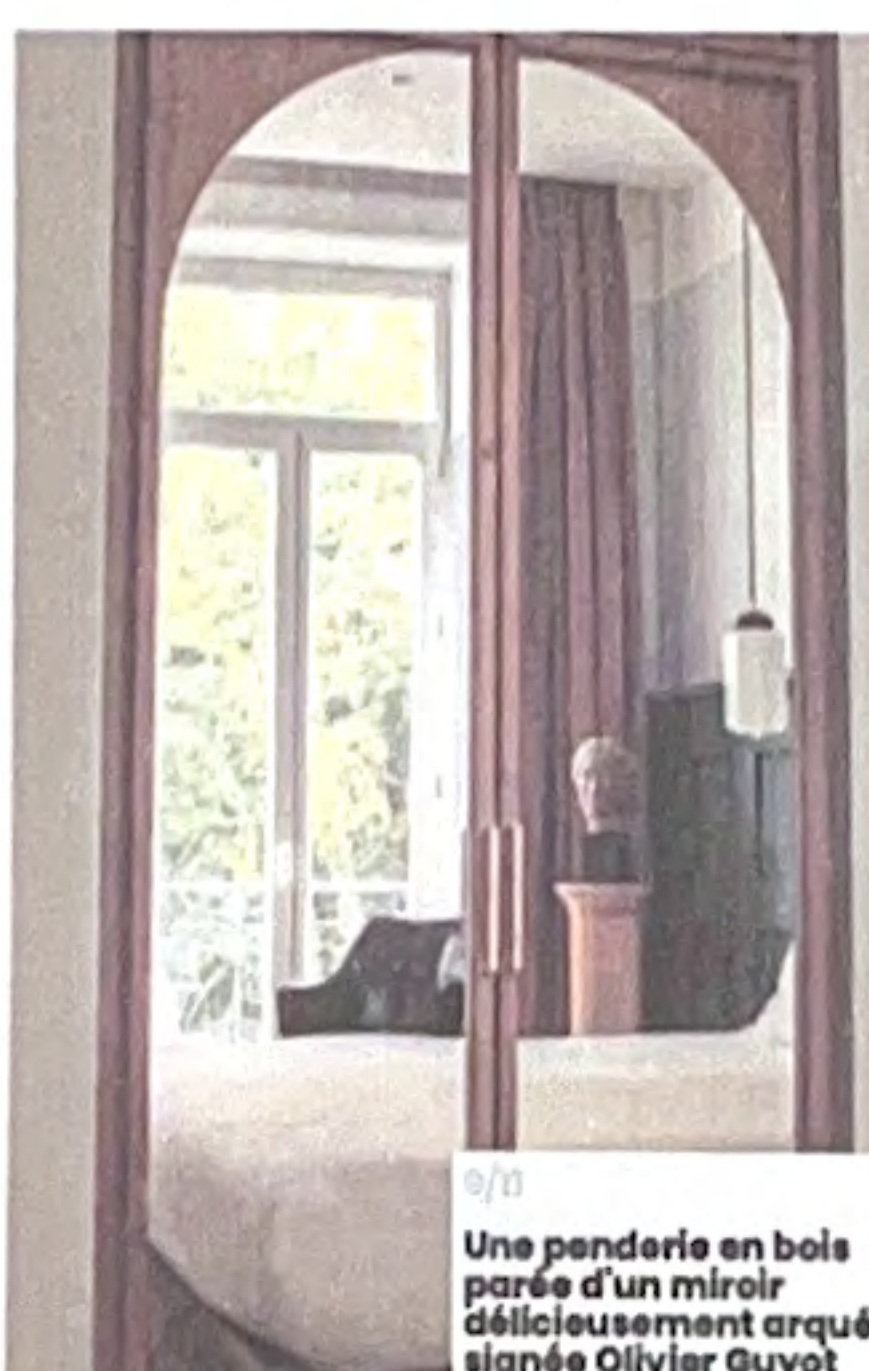
9/1 Une penderie en bois parée d'un miroir délicieusement arqué signée Olivier Guyot