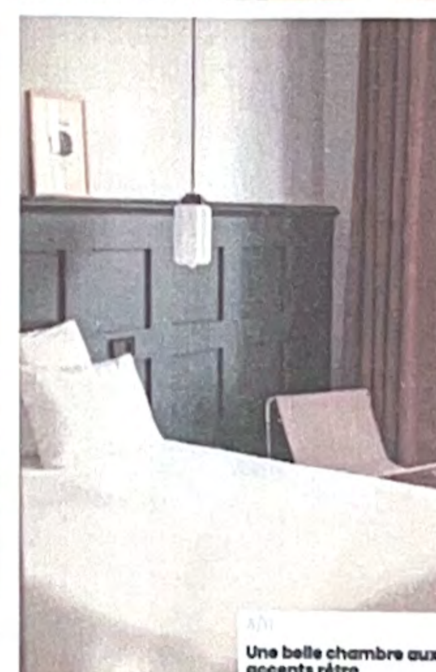
6/1 Une belle chambre aux accents rétro