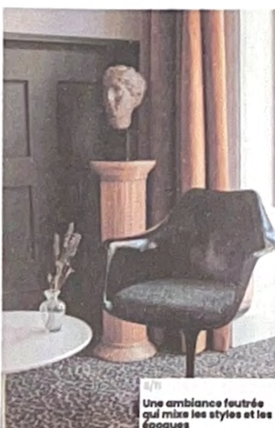
8/1 Une ambiance feutrée qui mixe les styles et les époques