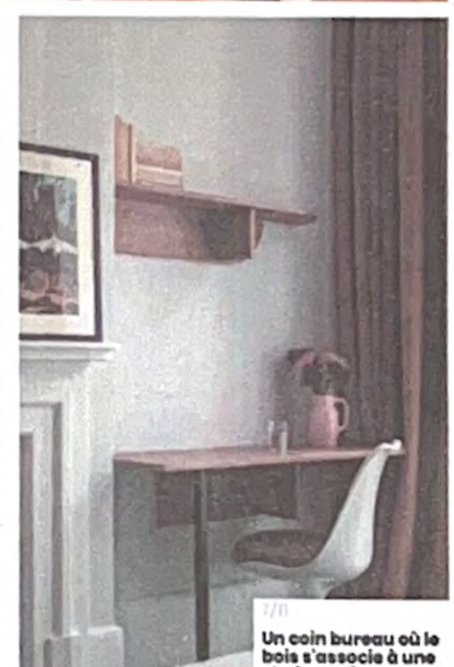
7/1 Un coin bureau où le bois s'associe à une chaise Tulip