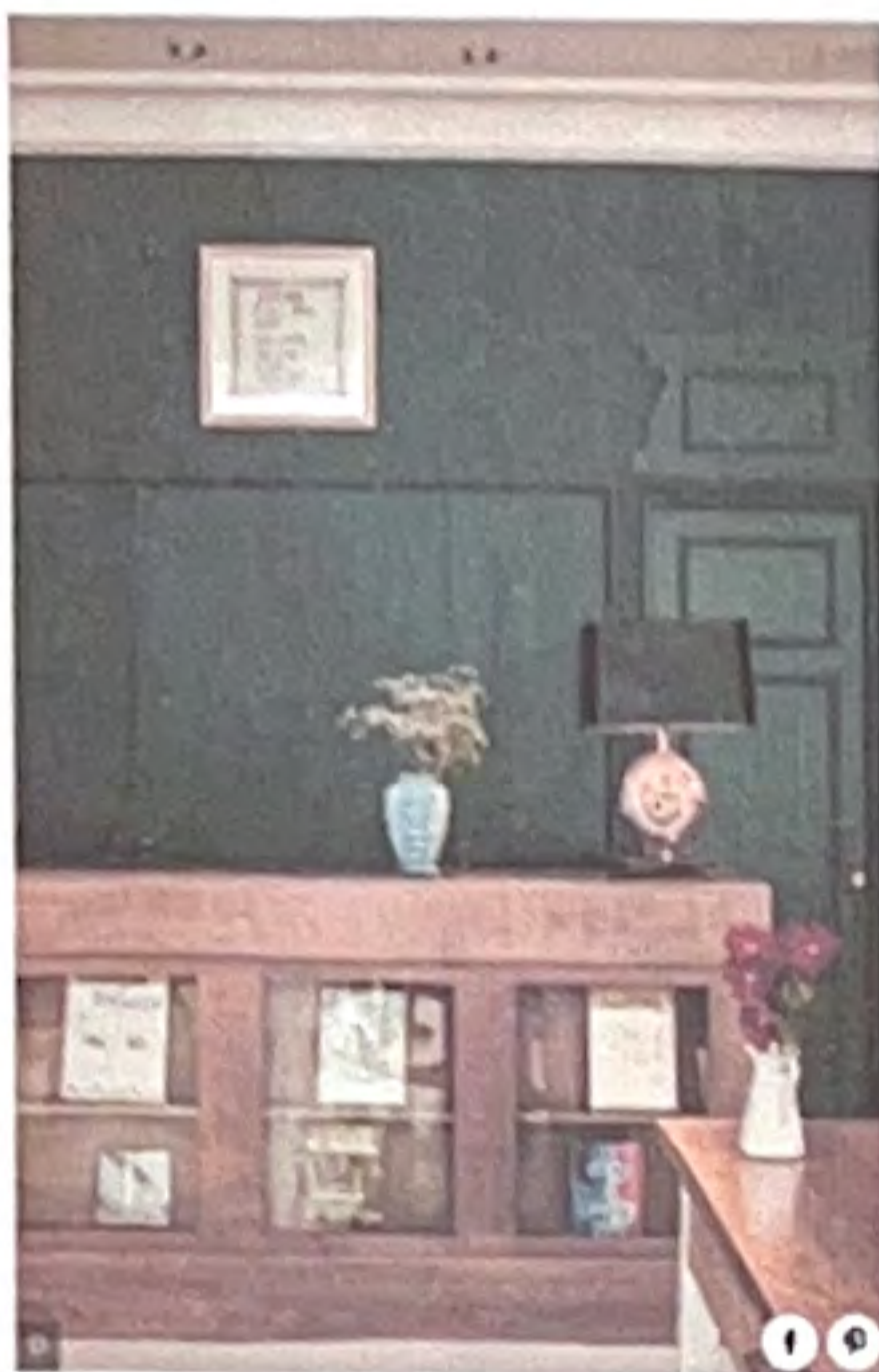
1/1 Un comptoir en bois où s'expose magazines et revues d'art