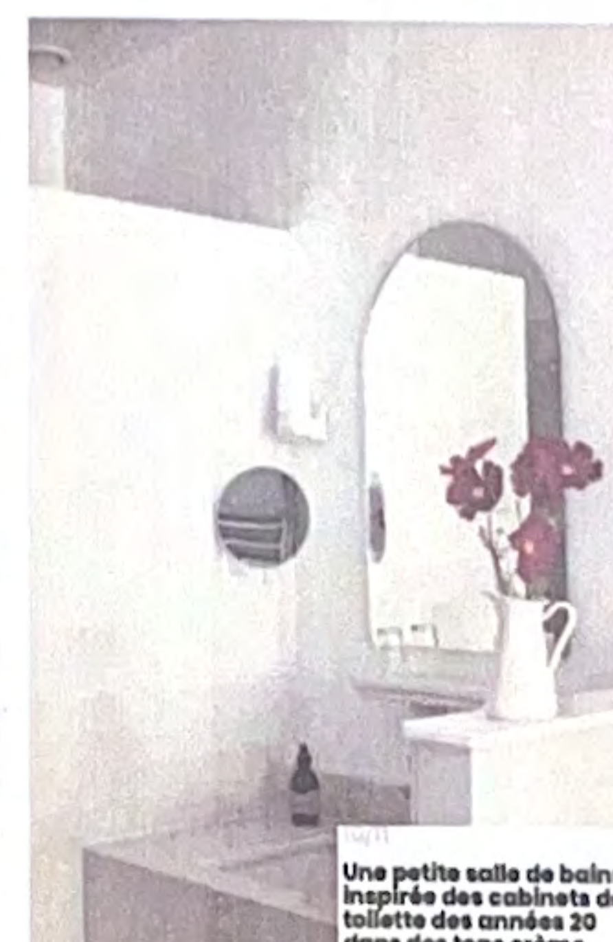
10/1 Une petite salle de bains inspirée des cabinets de toilette des années 20 dans des tons crème